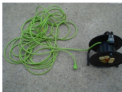
コードはリールから全部引き出す！