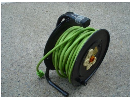
ドラムリール(コードリール)