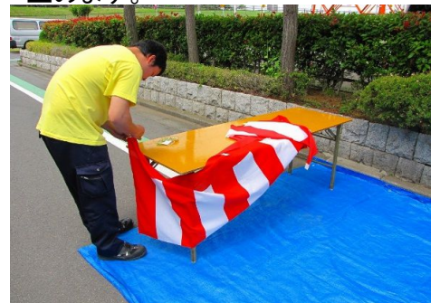
3.テーブル回りに紅白幕を画鋸で止めます。