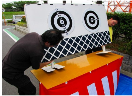
7.瓦塀に小鉄板が入りました。