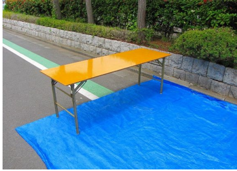
2.イベントテーブルを組立ます。