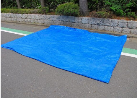
1.ブルーシートを敷きます。