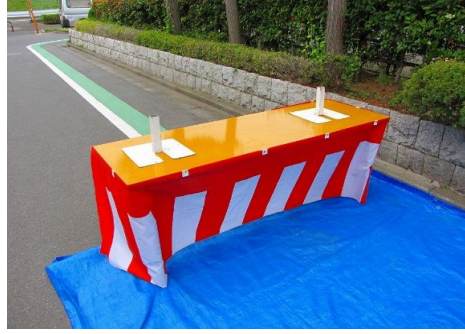
5.小鉄板をテーブルに乗せます。