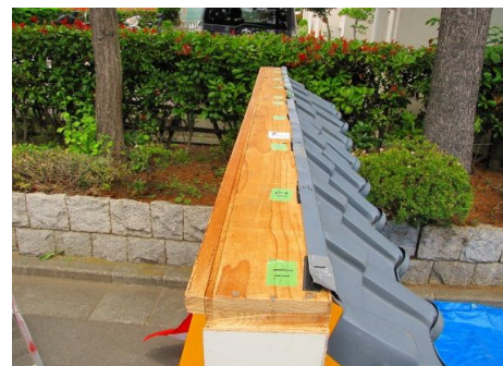
9.最後にかまぼこ型の屋根を乗せます。