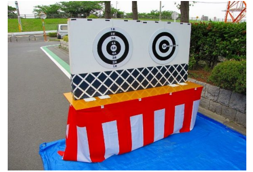
7.瓦塀に小鉄板が入りました。