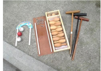
ウ)ゲート・ピン・玉・ボルト ・スティック