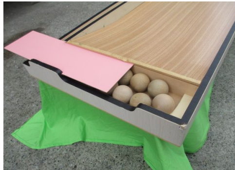
⑤ ボールは端に入っています。