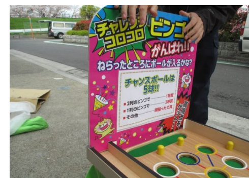
⑥ 看板を差し込みます。