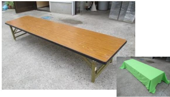
① テーブルを用意しクロスを掛けます。